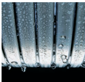
Ανοξείδωτος εναλλάκτης θερμότητας Inox-Radial