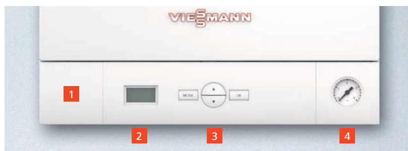
Πίνακας ελέγχου με ενσωματωμένο σύστημα αυτοδιάγνωσης βλαβών

Επίσης με την προσθήκη του εξωτερικού αισθητηρίου θερμοκρασίας (παρέχεται σαν αξεσουάρ) και την λειτουργία του λέβητα με αντιστάθμιση υπαίθρου επιτυγχάνεται ακόμα μεγαλύτερη εξοικονόμηση καυσίμου και άρα σημαντικό όφελος χρημάτων απλά και γρήγορα.